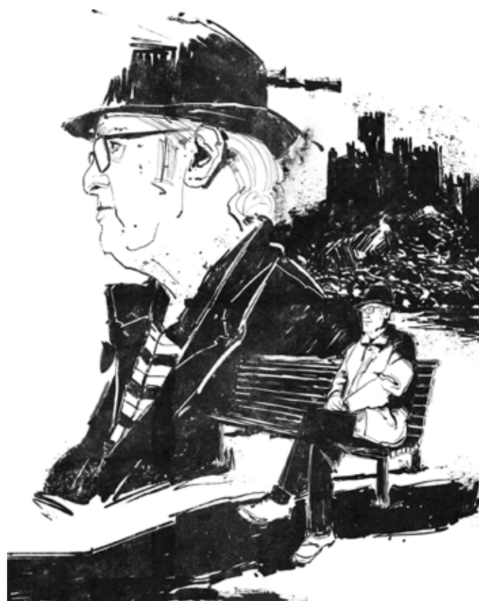
ILUSTRAÇÃO: MIKE BISPO

In Rede de Bibliotecas, Vila Nova da Barquinha